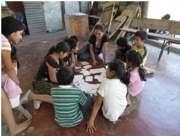
Schule unter freiem Himmel

Tilgungen den wirtschaftlichen und politischen Spielraum stark ein. Die Opposition spricht davon, dass die Regierung wirtschaftlich nicht handlungsfähig sei. Die andere Strategie der Opposition besteht darin, erst im letzten Moment der Neuverschuldung zuzustimmen, wenn kaum mehr Zeit dafür da ist, dieses Geld auszugeben. Die Regierung ist in dieser Phase nicht handlungsfähig. Darüber hinaus läuft sie Gefahr, Gelder zurückgeben zu müssen, weil sie sie nicht ausgeben konnte.