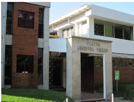
[Universität der Jesuiten (UCA)]

Was bleibt ist die Methode. Das Prinzip „Sehen – Urteilen – Handeln“, die kritische Analyse der sozialen Verhältnisse, das Konzept der strukturellen Sünde, die entschiedene Option für die Armen und die fundamentale Frage: Was sagt uns die frohe Botschaft des Evangeliums hier und heute? Auch wenn sich die Zeiten geändert haben, die Welt ist kaum friedlicher und gerechter geworden. Tausende Salvadorianerinnen arbeiten tagtäglich unter unmenschlichen Bedingungen in den „Maquilas“ der Textilindustrie. Landraub sowie Verschmutzung und Ausbeutung natürlicher Ressourcen durch multinationale Großkonzerne sind ein Fluch für unzählige Dorfgemeinschaften. Die Kriminalitätsrate erreicht derzeit einen neuen Gipfel in El Salvador und der Waffenstillstand der „Maras“ steht vor dem Aus. Jährlich machen sich eine halbe Million Mittelamerikaner auf den gefährlichen Weg in den Norden, auf der Suche nach einem Leben in Würde.