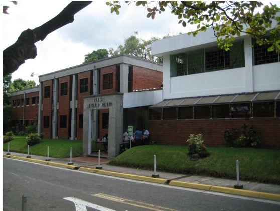
[Universität der Jesuiten]

ger.“ Befreiungstheologie ist Christentum auf dem Weg, unvollendet, fehlerhaft, dienend, von der Hoffnung getrieben.