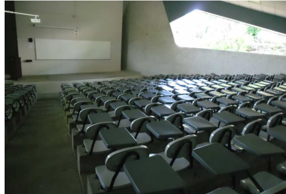
Hörsaal in der UCA

Ansprechende Gebäude, gepflegte Parks, überall Mülleimer (die nicht geklaut werden) lassen eine sehr angenehme Atmosphäre entstehen.