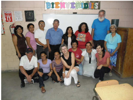
Mitglieder des Vereins „Jean Donovan“

Wir nahmen am Nucleo und am Treffen des Vereins „Jean Donovan“ teil.