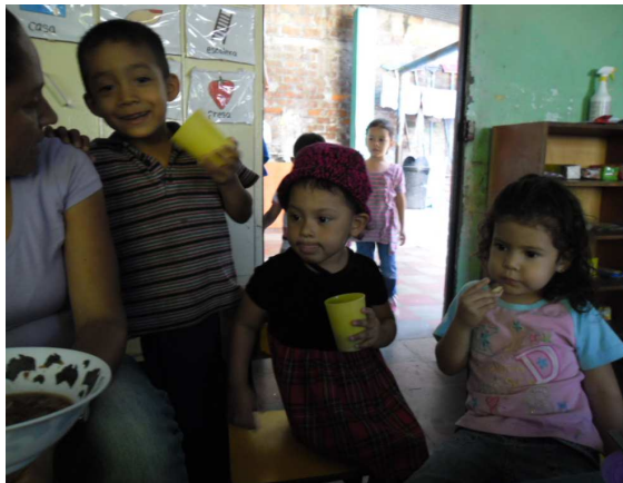
Kinder im Kindergarten

Wir konnten sehen, wie sinnvoll mit den gespendeten Geldern umgegangen wird. Neben den bekannten Tätigkeiten in der Schule, Schule unter freiem Himmel, Kindergarten und Clinica werden seit geraumer Zeit auch Computerkurse angeboten.