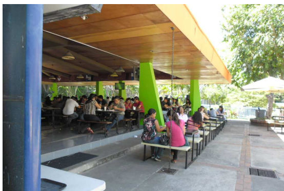
Mensa in der UCA

Eine schöne Erfahrung war unser Besuch in der UCA (Universidad Centroamericana) der Jesuiten. Das ist für jeden Studenten der Befreiungstheologie die erste Adresse. Beim Betreten dieses riesigen, umzäunten Geländes wähnt man sich in einer anderen Welt.