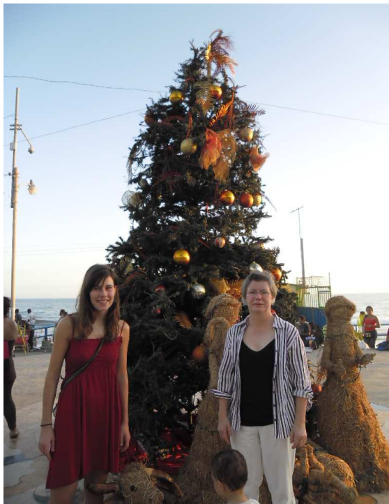
Unterm Weihnachtsbaum in La Libertad

Nach neun Jahren ist es mein dritter Besuch in dem kleinsten mittelamerikanischen Land. Beim Verlassen des Flughafengebäudes schlägt mir sofort feuchtwarmer, tropische Luft entgegen.