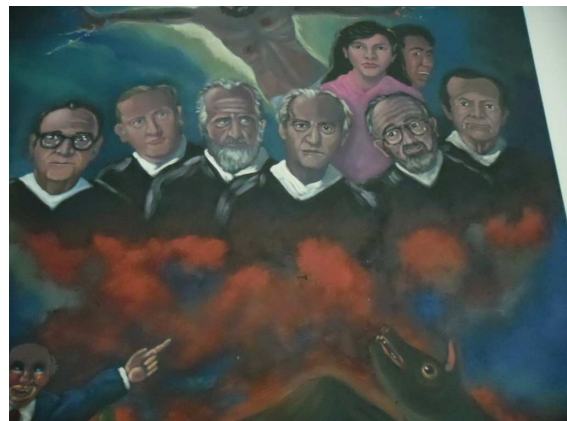
Bild der Ermordeten

Hier ist auch das Óscar Romero Gedächtnis-haus zu finden, in dem nicht nur die Geschichte von Óscar Romero zu sehen ist, sondern auch die Geschichte der Ermordung der sechs durch das Militärregime 1989 ermordeten Jesuiten sowie ihrer Köchin und deren Tochter.