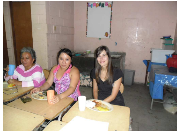
Mit Mitarbeiterinnen in den Projekten

Es waren intensive und bewegende Wochen in El Salvador. Es gäbe noch vieles zu erzählen, wie z.B. ein Tag an der Pazifikküste in La Libertad, einen Ausflug an die „Puerta del Diablo“, ein Besuch im Botanischen Garten mit den vielen tropischen Pflanzen, die Gottesdienstbesuche im „Rosario“ (Dominikanerkloster in San Salvador) und natürlich die vielen Begegnungen mit den Leuten.