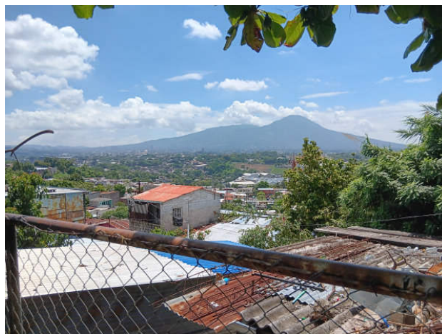
Blick über die Siedlung vom 22. April in Richtung San Salvador und Vulkan Boquerón

neu und Folgendes auch: An der einzigen Hauptstraße (Calle Central) stehen rechts und links eine Fülle von Autos. Es gibt kaum noch ein Durchkommen. Auf den Bürgersteigen mit den hohen Bordsteinkanten machen sich die vielen kleinen Lebensmittel-, Textil- und Obst- sowie Gemüsehändler breit. Man muss zwischen fahrenden, stehenden Autos und Verkaufsständen aufmerksam Slalom laufen. Die Kindertagesstätte und die Bibliothek des Vereins Jean Donovan liegen in diesem Viertel.