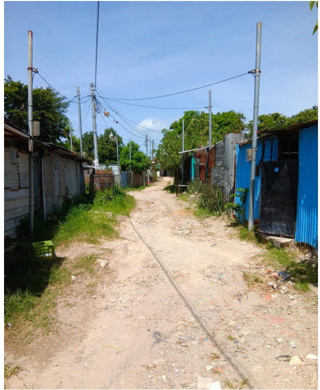
Siedlung „Bendición de Dios“

lichen Mitteln nicht gelungen ist, dieses Problem zu lösen.