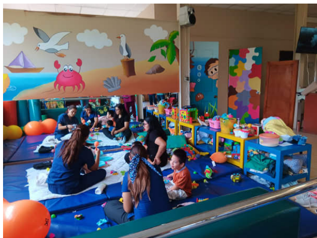
Hogar Padre Vito Guarato

te arbeiten für diese Menschen. Es lebt von Spenden aus dem In- und Ausland und ist in dieser Form in El Salvador einzigartig. Manche behinderten Menschen sind komplett von einer Betreuung und Pflege rund um die Uhr abhängig, manche können einiges selbst regeln und z.B. in der Küche oder Wäscherei mithelfen. Sehr bewegend war es zu beobachten, wie physiotherapeutische Fachkräfte die Heimbewohner zur Bewegung motivierten, sie liebevoll massierten und ihnen Zuwendung schenkten. Viel Freude gaben ihnen Bewegungs- und Geschicklichkeitsspiele, in die wir Besucher auch einbezogen wurden. Es wurde angefeuert und gelacht und auch zuschauende schwer behinderte Menschen erfreuten sich erkennbar daran. Dieser Besuch hat unsere Überzeugung gestärkt, dass es richtig war, auch dieses Heim in unsere Förderung aufzunehmen, und zu hoffen, dass wir dafür unser Spendenvolumen steigern können.