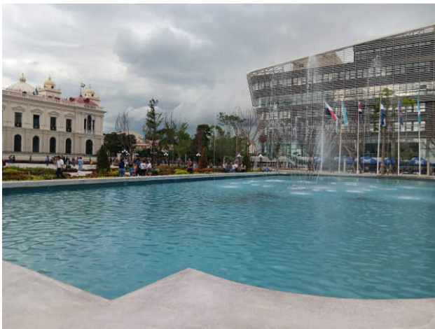
San Salvador, Zentrum mit Nationalpalast (links) und Nationalbibliothek (rechts)

Und wie sieht es jetzt im Zentrum von San Salvador aus? – Wir stehen an einem heißen, schwülen Julitag auf dem großen Platz vor der neuen Staatsbibliothek von El Salvador, ein hohes Gebäude mit Glasfassade, Sinnbild für Veränderungen im Zentrum von San Salvador. Alles sauber, frisch gestrichen, sogar blaue Radwege, allerdings keine Radfahrer. Die Kathedrale leuchtet weiß. Die schwüle Hitze drückt. Die uns früher so vertrauten Verkaufsstände an den Straßenrändern sind weg, die Händlerinnen und Händler vertrieben, Ausdruck einer autokratischen Politik, an deren Spitze Präsident Nayib Bukele steht. Er will das Land modernisieren, Touristen und Investoren anlocken.